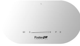
Piano cottura Touch Control Modular Induction