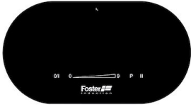
Piano cottura Touch Control Modular Induction